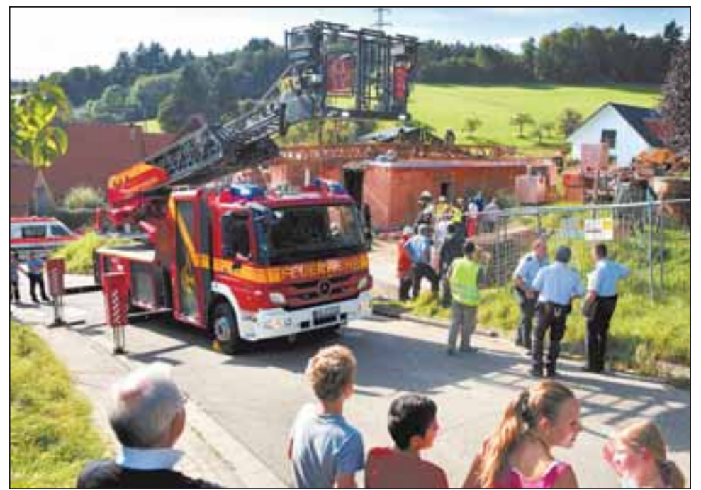
Drei Verletzte, zwei davon schwer, und ein beschädigter Rohbau sind das Ergebnis von Bauarbeiten in Leimen-Lingental, bei denen gestern Nachmittag ein Baukran abknickte.

Wieso der Baukran einknickte, ist bislang noch unklar. Die Baustelle sowie der Kran wurden beschlagnahmt. Das Gewerbeamt des Rhein-Neckar-Kreises wurde eingeschaltet. Über die Höhe des Sachschadens, der am Rohbau entstanden ist, gibt es laut Polizei noch keine Angaben. Die weiteren Ermittlungen zur Unfallursache hat die Kriminalpolizei der Region Heidelberg übernommen. Außerdem wurde ein Sachverständiger zur Klärung des Unfallhergangs hinzugezogen.